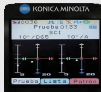
Gráfico de diferença de cor