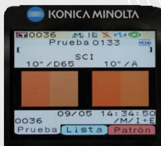
Simulação de cor