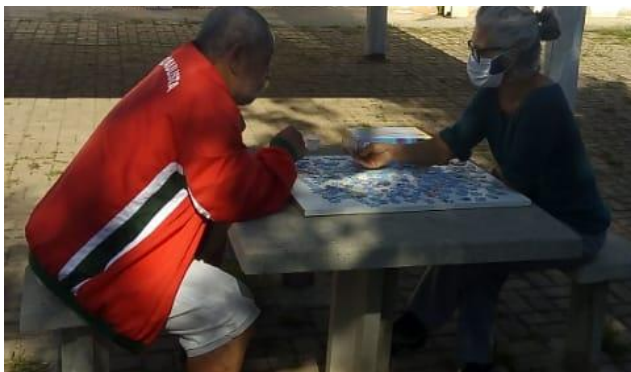
Atividade de convivência