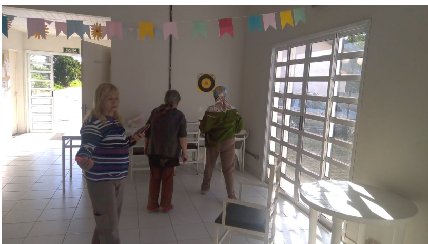
Atividades de convivência no Salão