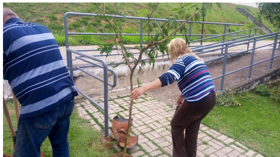
Plantio de mudas