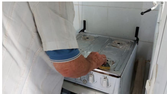
Limpeza no interior da residência