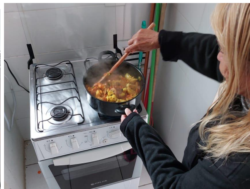
Atividade de culinária