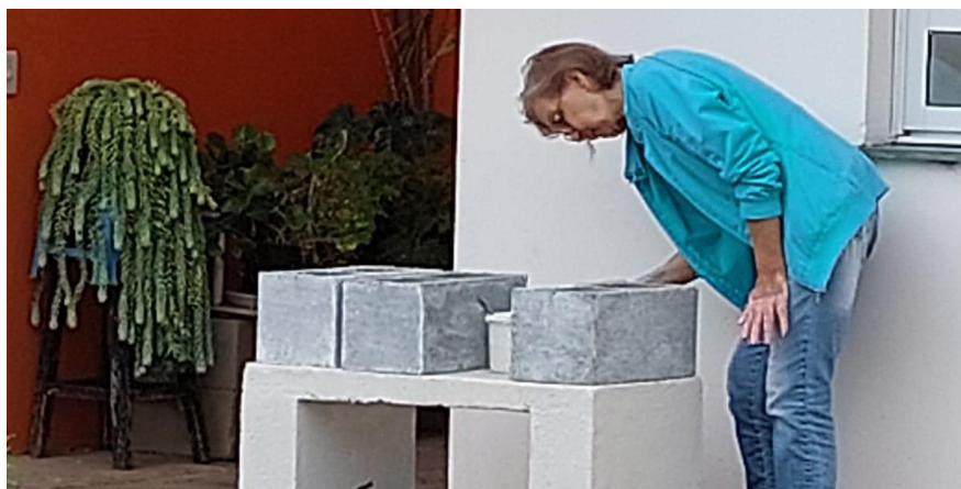
Atividades de artesanato