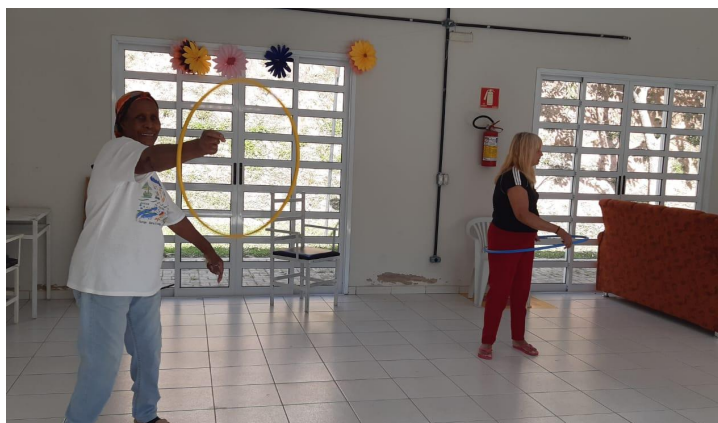
Atividade de convivência no salão