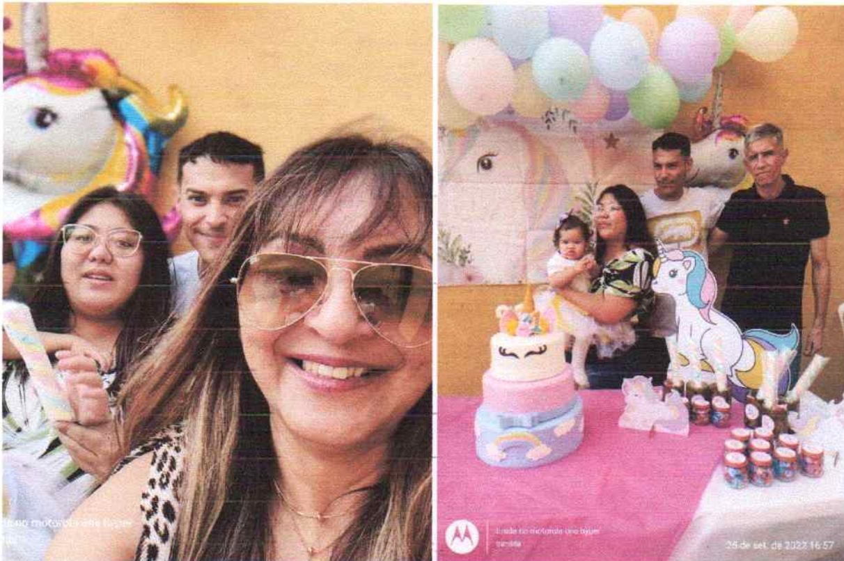
Visita pós Republica – voltando para a família

CASA SANTA MARTA - CASAMAR CNPJ – 02.818.105/0001-88 Reg. CMAS nº 10.033 (Lei 4891/96 Art. 3º) Utilidade Pública Municipal (Lei 5383 de 28/12/1999) Utilidade Pública Estadual (Lei 10.915 de 04/10/2001) Utilidade Pública Federal Processo SMJ 0815.013666/2002-41 Port. 2.226 de 12/12/2002 Reg. C.N.A. S. nº 0282/2002 de 18/06/2002 – D.O. U. de 05/07/2002 – Proc. 44006003086/2201