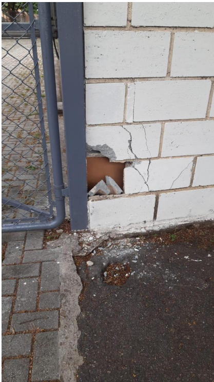
Acidente com o Muro externo