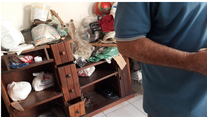
Retirada de material reciclável e lixo de uma das unidades