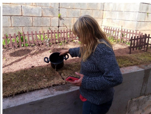
Participação dos moradores no cuidado do salão e Jardim